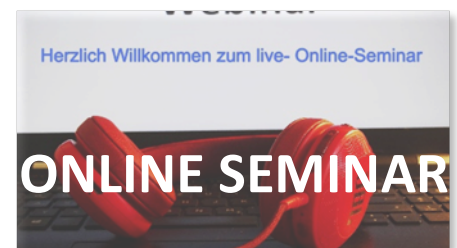
Die drei Online-Angebote von EQASce, TiGA und GenoAkademie.